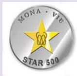
1 - JOSÉ ARISTÓTELES CHAVES